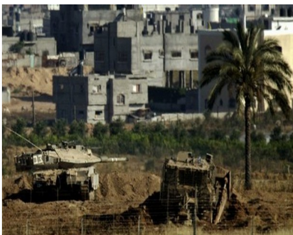
Raid in Gaza met Merkava Tank en bulldozer; 23 mei 2007

Een andere interessante standhouder op de ITEC beurs is het relatief onbekende L-3 Communications. L-3 Communications is één van de grootste defensiebedrijven in de VS. Ze zijn koploper in intelligence, bewaking en herkenning, beveiligde communicatie, training en simulatie en modernisering en onderhoud van vliegtuigen. 13