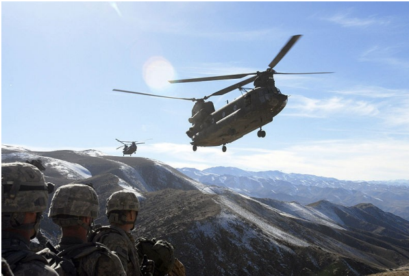
Chinook in afghanistan

Serco is bovendien één van de grote verdiemers aan de oorlog in Irak. Bedrijven als Serco slaan daar twee vliegen in één klap: ze verdienen geld met de voorbereidingen van de oorlog, en vervolgens sluiten ze lucratieve deals voor heropbouwprojecten.