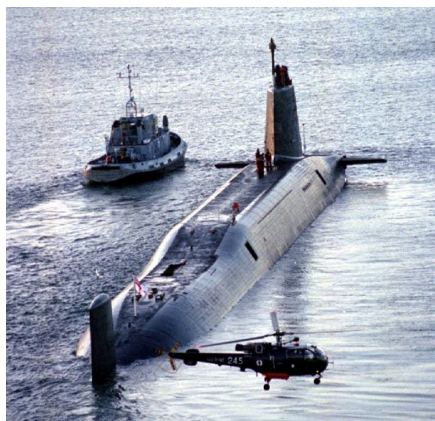
nucleaire Vanguard onderzeeër

Serco is een andere opvallende aanwezige op de ITEC beurs. Dit Britse bedrijf is op heel uiteenlopende markten actief: zowel in Europa en de VS als de Pacific en het Midden-Oosten (Verenigde Arabische Emiraten). Ook in België heeft Serco een zetel (Av Edmond Van Nieuwenhuysse 6, B-1160 Brussels).