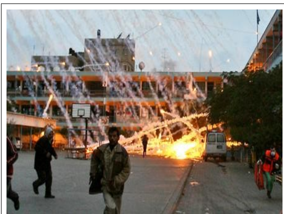
Gaza, 17th January 2009.

Article 51 of Additional Protocol I prohibits indiscriminate attacks, which are those “of a nature to strike military objectives and civilians or civilian objects without distinction.”