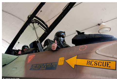
F-16I Squadron van Cast Lead

De toestellen werden onder andere ingezet in de operatie Cast Lead in de Gaza-strook, december 2008, januari 2009. F-16I-toestellen werden ook gebruikt in de aanvallen op Libanon in juli 2006 en voor de aanval op Syrië op 6 september 2007. 6