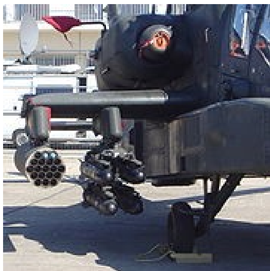
Hellfire raketten Lockheed Martin, ingezet door het Israëlijsche leger

Deze bedrijven leveren wapens en trainingsmateriaal aan het Israëlijsche leger, die worden ingezet bij aanvallen op onder meer Libanon en de bezette gebieden. Israël komt regelmatig in opspraak omwille van schendingen van internationaal recht. De wapens en bijhorende simulatie- en oefenapparatuur, maken de militaire operaties van het Israëlijsche leger mogelijk. De concrete voorbeelden van schendingen van mensenrechten bij militaire operaties zijn uitgebreid gedocumenteerd. Naar aanleiding van de operatie 'Cast Lead', publiceerde Amnesty International een rapport waarin in detail beschreven wordt welke wapens en munitie werden ingezet door het Israëlijsche leger, en wat de gevolgen hiervan waren voor de burgerbevolking. De organisatie concludeert dat de ernst van de vaststellingen van die aard is dat onmiddellijk een wapenembargo moet komen aan alle partijen in het conflict.